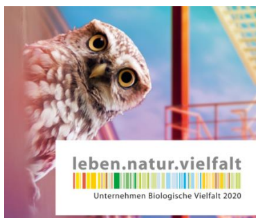
Bild: Ein Projekt der Aktionsplattform von Unternehmen Biologische Vielfalt 2020